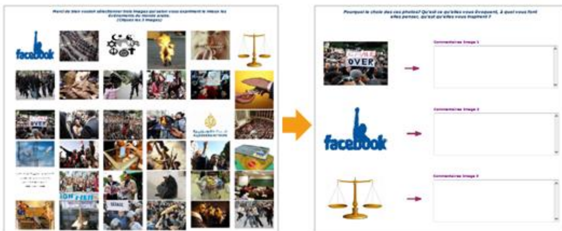
Figure 2 : Le mur d'images de l'enquête reflets méditerranéens du printemps arabe

La figure 2 présente le mur d'images conçu lors de l'enquête 4 menée dans le cadre du projet «reflets méditerranées». Mené par un collectif de chercheurs d'universités françaises et tunisiennes juste après les événements du printemps arabe, il vise à étudier la représentation sociale de ces événements et de la démocratie sur les deux rives de la méditerranée, et à identifier les acteurs et les médias impliqués dans ces révolutions (Boughzala et al., 2012; Moscarola et al., 2012.). 859 personnes de plusieurs pays du pourtour méditerranéen (France, Tunisie, Algérie, Maroc...) ont répondu à cette enquête. Les réponses aux questions ouvertes interpellant les répondants sur leurs choix d'images représentent environ 28 000 mots, soit 80 pages.