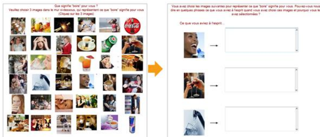
Figure 1 : Le mur d'images de l'enquête sur la consommation de boisson en Europe

La figure 1 présente le mur d'images construit lors d'une enquête en ligne 3 en 23 langues et menée sur la consommation des boissons en Europe lors d'un projet de recherche nommée « Coberen » (Ganassali et Mestrallet, 2012). Son objectif est d'étudier les similarités et les différences parmi les cultures de consommation en Europe. 5250 personnes ont répondu à cette enquête. Le corpus total des réponses aux questions d'interpellation aux images représente 106 360 mots dont 24 515 sont différents.