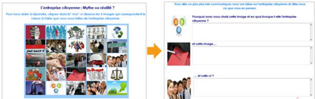
Figure 3 : Le mur d'images de l'enquête sur la perception de l'entreprise citoyenne

La figure 3 présente le mur d'images de l'enquête 5 sur la perception de l'entreprise citoyenne en Tunisie et en France. Au total, 461 personnes ont répondu au questionnaire et 50 pages de texte ont été saisis en réponse aux questions sur le choix d'images (Moscarola, 2012).